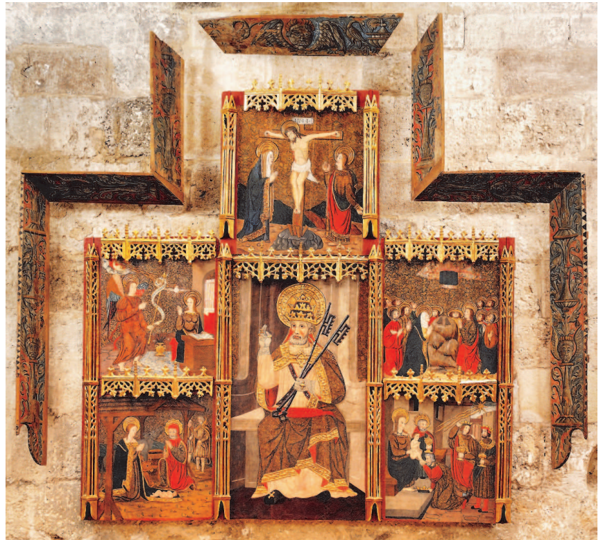
Retaula de sant Pere, restaurat en 2010, en l'Església de Sant Joan de l'Hospital de València.

En aquella arca se salvaren a través de l'aigua unes